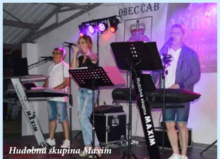
Hudobná skupina Maxim