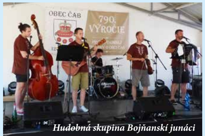
Hudobná skupina Bojňanskí junáci