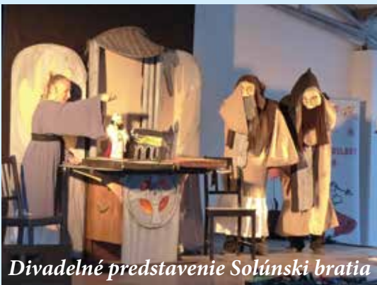
Divadelné predstavenie Solúnski bratia