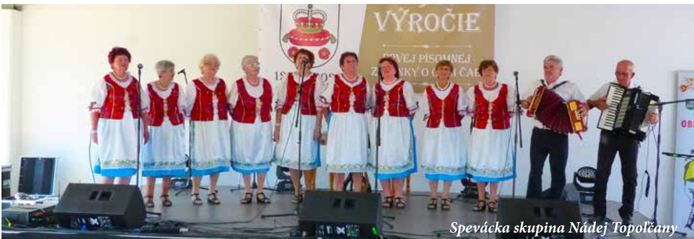
Spevácka skupina Nádej Topoľčany