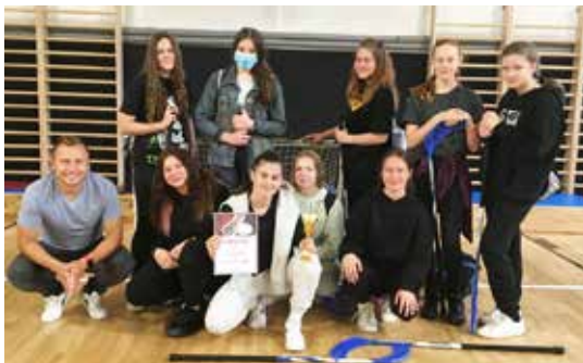
2. miesto Florbal staršie žiačky

sa umiestnili na popredných miestach Nitrianskeho okresu. Za príkladnú reprezentáciu im patrí veľká vďaka.