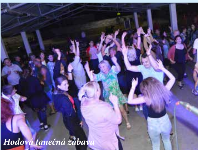
Hodová tanečná zábava