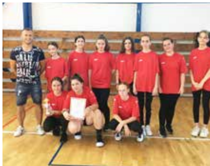
2. miesto Vybíjaná mladšie žiačky