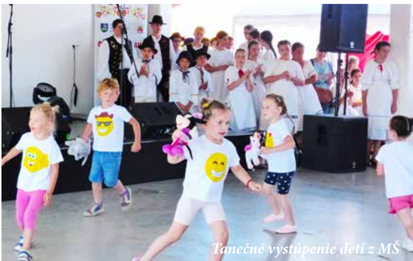
Tanečné vystúpenie detí z MŠ