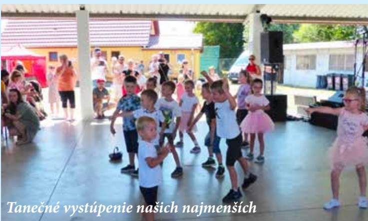
Tanečné vystúpenie našich najmenších