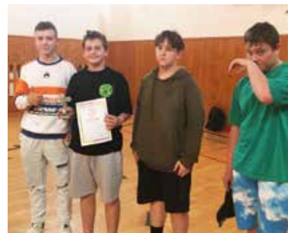
3. miesto Stolný tenis starší žiaci