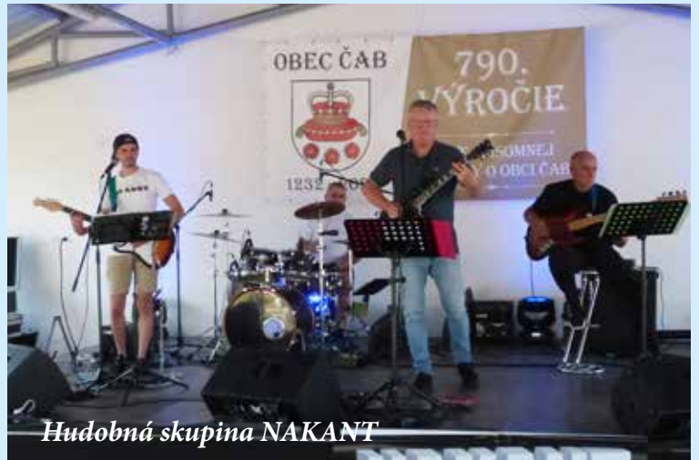
Hudobná skupina NAKANT