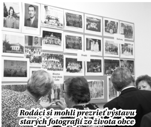
Rodáci si mohli prezrieť výstavu starých fotografií zo života obce