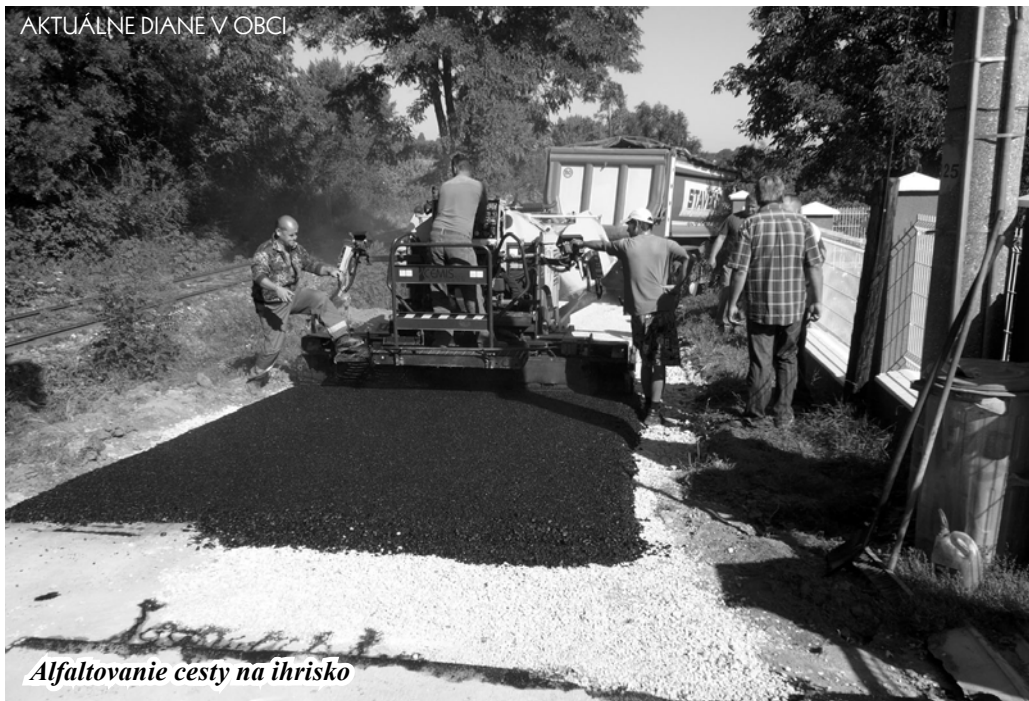
Alfartovanie cesty na ihrisko