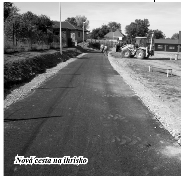
Nová cesta na ihrisko