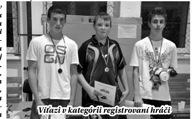
Vitazi v kategórii registrovaní hráči

Stolnotenisový klub Nitra 08 v spolupráci s mestom Nitra a Strednou odbornou školou potravinárskou na Cabajskej ulici v Nitre usporiadali 10. 10. 2012 v telocvični SOŠ Potravinárskej pri príležitosti Dní športu mesta Nitry stolnotenisový turnaj žiakov základných a stredných škôl. Celkove 24 prihlásených žiakov, ktorí súťažili v dvoch kategóriách (registrovaní a neregistrovaní žiaci), si schuti a do sýtosti zašportovalo a ukázalo veľmi dobré výkony za stolmi s celuloidovou loptičkou. V oboch kategóriách sa najskôr hralo skupinovým systémom.