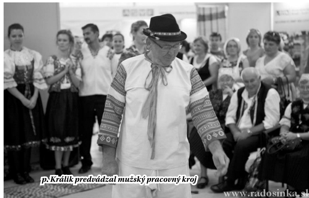
p. Králik predvádzal mužský pracovný kroj