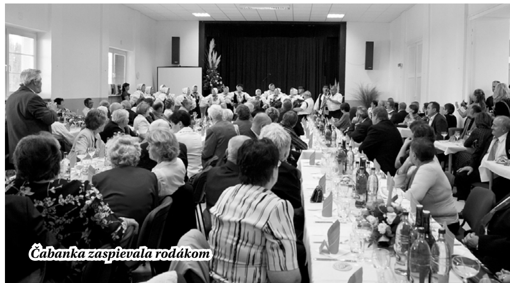
Čabanka zaspievala rodákom