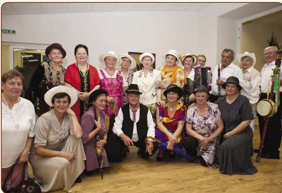
Americké dôchodkyne v podaní speváckej skupiny Čabanka