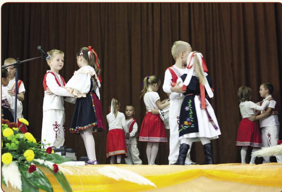
Tanec škôlkarou na Stretnutí rodákov