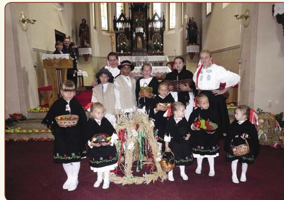
Vystúpenie detského folklórneho súboru Pelikánik na Ďakovnej svätej omši