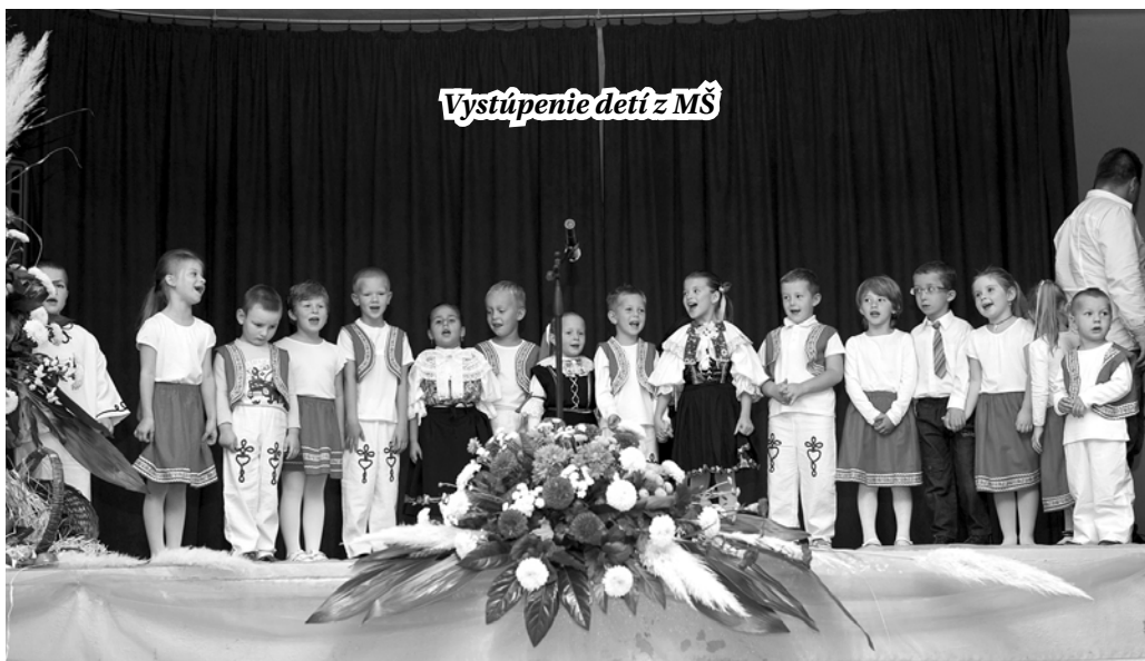
Vystúpenie detí z MŠ