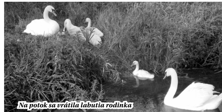
Na potok sa vrátila labutia rodinka

Športovcom pripomínam, že ak sú odpadové koše v športovom areáli plné a nezmesť sa do nich už žiaden odpad, nerozhadzujte ďalšie odpadky po okolí, ale si ich vezmite zo sebou a odhodte ich do koša až doma. Zabráňte tak znečisteniu športového areálu.