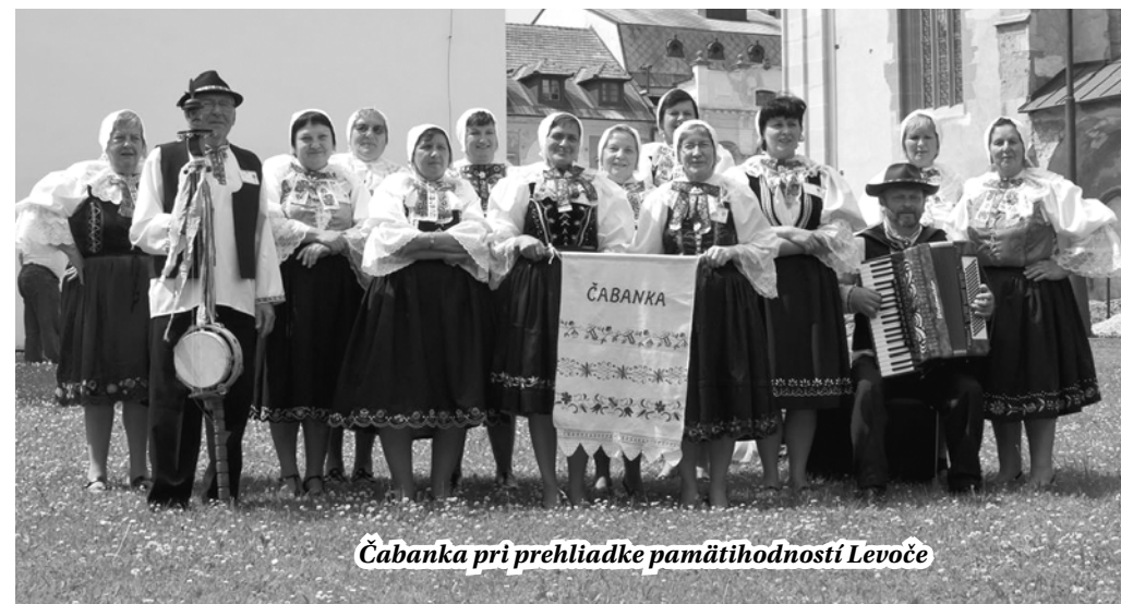
Čabanka pri prehliadke pamätihodností Levoče