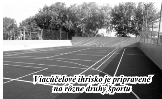
Viacúčelové ihrisko je pripravené na rôzne druhy športu

Upozorňujem tiež rodičov malých detí, ktoré sa hrávajú na ihrisku a v okolí šatní na športoviskách, aby ich sústavne upozorňovali na to ako sa majú správať. Skontrolujte