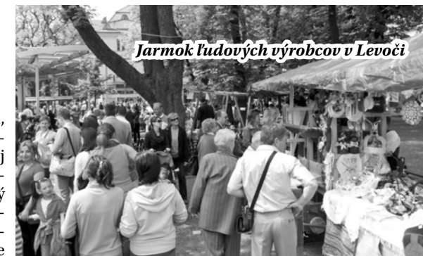
Jarmok ľudových výrobcov v Levoči

Keď nastal deň „D“, 30.5.2012, skoro ráno sme nastúpili do autobusu a pred obedom sme dorazili do Levoče. Obliekli sme si kroje a absolvovali prehliadku tohto krásneho mesta. Na námestí sa už od rána striedali