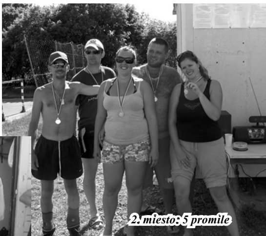
2. miesto: 5 promile

Tak ako sa minulý rok predpokladalo tak sa tento rok aj stalo. Po 0. ročníku sme sa rozhodli zorganizovať I. ročník Čabského volejbalového turnaja. Športové podujatie sa uskutočnilo dňa 16. júna. 2012 so začiatkom o 9:00 hodine. Nakoľko turnaj nebolo možné zorganizovať v športovom areáli v Čabe, presunuli sme tento ročník na multifunkčné ihrisko do Nových Sadoch.