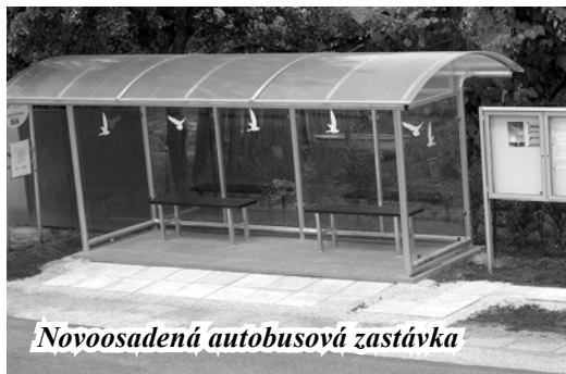
Novoosadená autobusová zastávka

vo verejných súťažiach na dodávku technológie, nádob a výstavbu kompostárne. Kompostáreň biologického odpadu bude vo Výčapoch - Opatovciach a technologická linka na triedenie odpadu v Lužiankach. V tomto roku sa začne s dodávkami odpadových nádob na triedenie odpadu (papier, sklo, bioodpad a PET fľaše) do obcí a následne rozdeľovanie do domácností. Vzhľadom na veľký rozsah projektu (pre 63 obcí) je realizácia značne obtiažna. O jej ďalšom priebehu Vás budeme, vážení občania, postupne informovať.