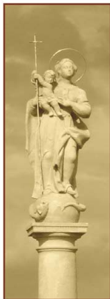
Nový stĺp z r.1773