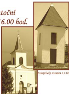
Kaplnka sv. Cynlá a Metoda z r.1889

Cena lístka je 15 €/1 osoba V cene je zahrnuté: príspevok, 1/2 l vína minerálna 1. večera, 2. večera, káva zápisok.