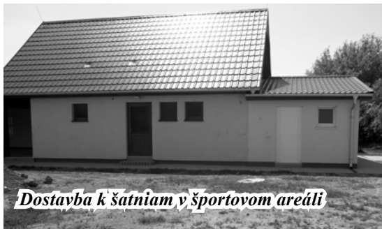
Dostavba k šatniam v športovom areáli