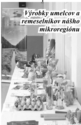
Výrobky umelcov a remeselníkov nášho mikroregiónu