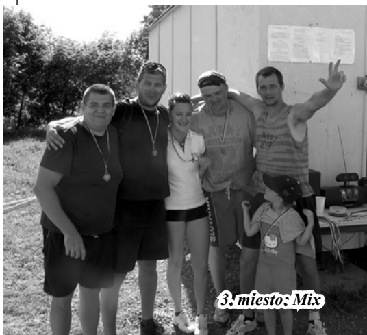
3. miesto: Mix

Od skorého rána nám svietilo slnko, hrala hudba, varil sa guláš. Pripravili sme stoly, lavice, slnečníky a samozrejme v neposlednom rade aj občerstvenie. Turnaja sa zúčastnilo 5 družstiev s piatimi hráčmi. Po zahájení turnaja sa rozlosovali zápasy a začalo sa hrať. Každé jedno družstvo bolo pripravené a plne sa sústredilo na hru. Zápasy boli vyrovnané a poriadne napínavé. Hralo sa na dva víťazné sety, spôsobom každý s každým. Po hodinách zábavy, športu a fandaní sme sa posilnili výborným gulášom a dostali sme sa k poslednému zápasu po ktorom nasledovalo vyhodnotenie turnaja, odovzdávanie medailí a putovného pohára do rúk víťazov. Na piatom mieste sa umiestnilo družstvo Greenhorse, na štvrtom mieste družstvo Pavúci, na treťom mieste sa s bronzovými medailami umiestnilo družstvo Mix, na druhom mieste so striebornými medailami družstvo 5 % a na prvom mieste a