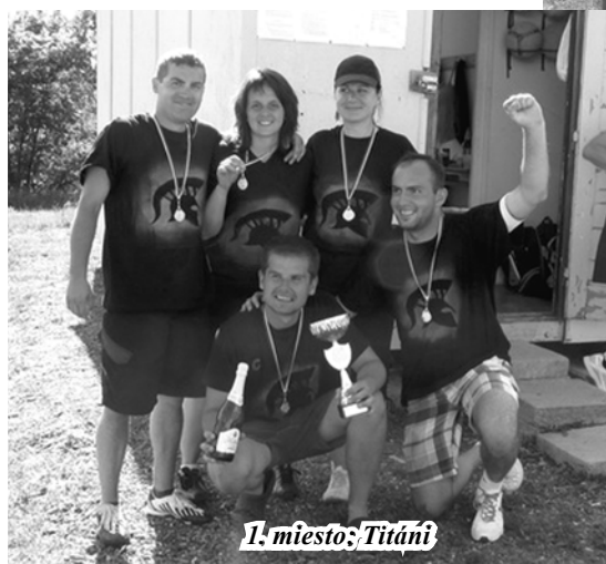
1. miesto: Titáni

Od skorého rána nám svietilo slnko, hrala hudba, varil sa guláš. Pripravili sme stoly, lavice, slnečníky a samozrejme v neposlednom rade aj občerstvenie. Turnaja sa zúčastnilo 5 družstiev s piatimi hráčmi. Po zahájení turnaja sa rozlosovali zápasy a začalo sa hrať. Každé jedno družstvo bolo pripravené a plne sa sústredilo na hru. Zápasy boli vyrovnané a poriadne napínavé. Hralo sa na dva víťazné sety, spôsobom každý s každým. Po hodinách zábavy, športu a fandaní sme sa posilnili výborným gulášom a dostali sme sa k poslednému zápasu po ktorom nasledovalo vyhodnotenie turnaja, odovzdávanie medailí a putovného pohára do rúk víťazov. Na piatom mieste sa umiestnilo družstvo Greenhorse, na štvrtom mieste družstvo Pavúci, na treťom mieste sa s bronzovými medailami umiestnilo družstvo Mix, na druhom mieste so striebornými medailami družstvo 5 % a na prvom mieste a