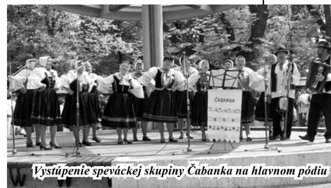
Vystúpenie speváckej skupiny Čabanka na hlavnom pódium