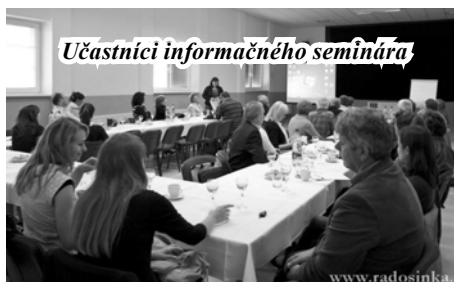
Učastníci informačného seminára

Druhý júnový týždeň sa v Kultúrnom dome v obci Čab a v priestoroch kancelárie OZ Mikroregión RADOŠINKA uskutočnil informačný seminár a školenie s názvom „ZAVÁDZANIE REGIONÁLNEHO ZNAČENIA NA NITRIANSKOM VIDIEKU“.