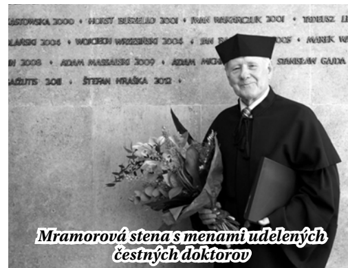
Mramorová stena s menami udelených čestných doktorov

skou poľnohospodárskou univerzitou v Nitre, kde menovaný pôsobil 28 rokov a z tohto