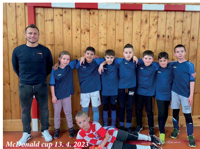
McDonald cup 13. 4. 2023