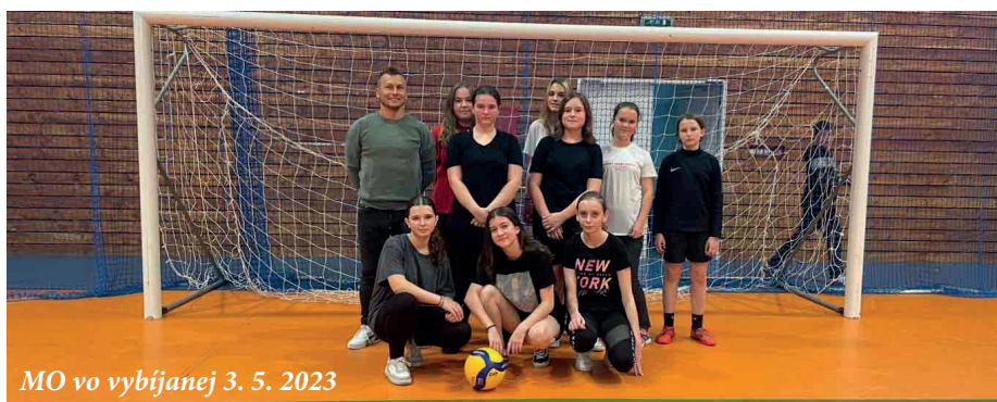
MO vo vybíjanej 3. 5. 2023