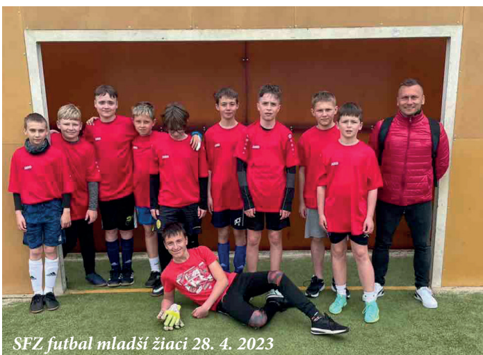
SFZ futbal mladší žiaci 28. 4. 2023