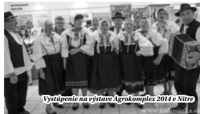
Vystúpenie na výstave Agrokomplex 2014 v Nitre

Posledné naše vystúpenie sa konalo v Malom Záluží, kde sa od rána vo veľkých kotloch varil slivkový lekvár tak, ako si to pamätajú staršie generácie. Varenie sme prítomným sprijemňovali našim vystúpením, a odmenou nám bola najskôr krásna vôňa lekváru, potom aj jeho ochutnávka. Aby sme v hanbe nezostali, zaradili sme do nášho programu aj varenie lekváru vo vlastnoručne zhotovenej tzv. danfovici, ktorá pozostávala z dvoch plechoviek, väčšej a menšej, a z drôtu. Na väčšej plechovke sa vyrezali dvierka a prieduchy, vo vnútri sa založil oheň, potom sa menšia plechovka s kúskami sliviek a cukru vložila do menšej tak, aby bola nad ohňom. Na obe plechovky sa pripevnil pevný drôt a celé zariadenie sa poriadne rozkrútilo, aby sa oheň dobre rozohrel. Po asi 15 minútach sa slivky s cukrom zmenili na chutný lekvár. Takto si vraj v Čabe chlapi