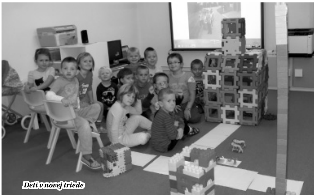
Deti v novej triede