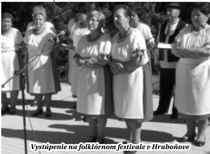
Vystúpenie na folklórnom festivale v Hruboňove

V auguste sme boli dvakrát vystupovať pri príležitosti dožínok, v Šuriankach a v Drazovciach. Vystúpenia Čabanky boli súčasťou sprievodných programov ukončenia žatvy. V auguste sme mali ešte jeden príjemný zážitok, mali sme tú česť predviesť sa pod záštitou Mikroregiónu Radošinka na výstave Agrokomplex 2014. Bol to trochu iný typ vystúpenia, diváci prichádzali a odchádzali, čo nás však tešilo, mnohí prišli a zotrvali a počúvali naše piesne.