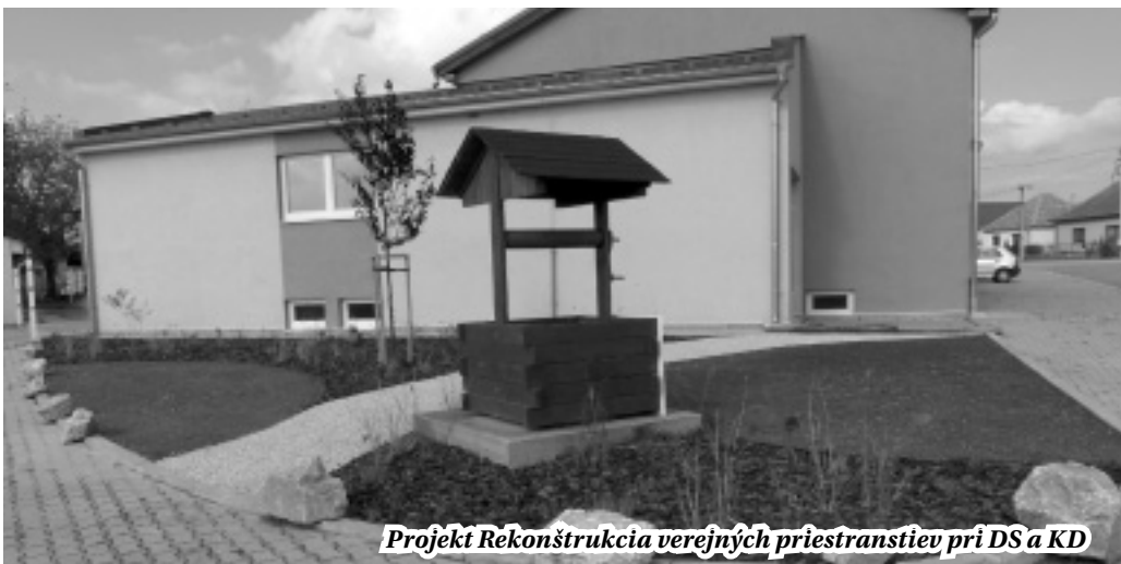
Projekt Rekonštrukcia verejných priestranstiev pri DS a KD

úlohu v tomto programovacom období zohrá naša obec ukáže najbližšie obdobie.