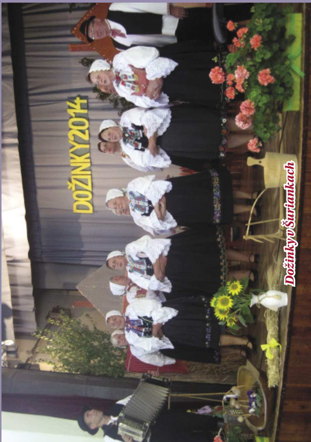
Dožinky v Šuriankach