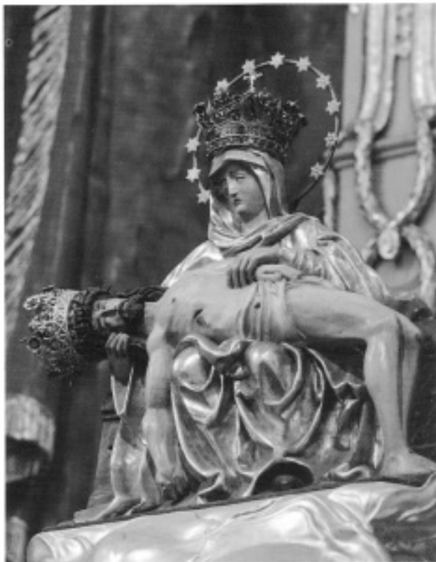
Matka Sedembolestná, naša Patrónka, oroduj za nás u Syna!