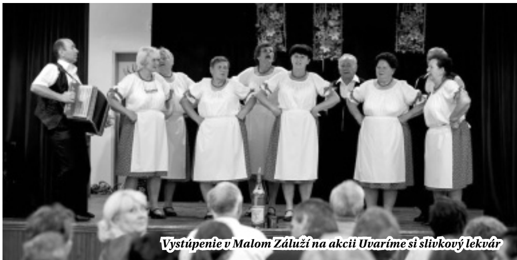
Vystúpenie v Malom Záluží na akcii Uvaríme si slivkový lekvár