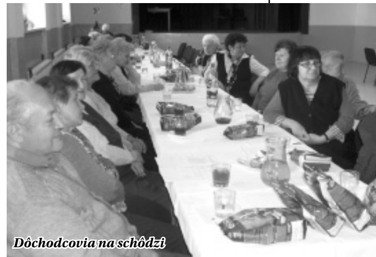
Dôchodcovia na schôdzi

Výbor sa vo svojej činnosti riadi Stanovami JDS, úzko spolupracuje so starostom obce, obecným zastupiteľstvom a všetkými organizáciami pôsobiacimi v obci. Každoročne na výročnej členskej schôdzi schvaľujeme plán činnosti a návrh rozpočtu a hodnotíme činnosť a výsledky hospodárenia za predchádzajúci rok.