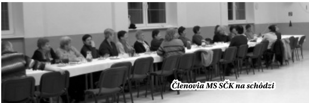
Členovia MS SČK na schôdzi