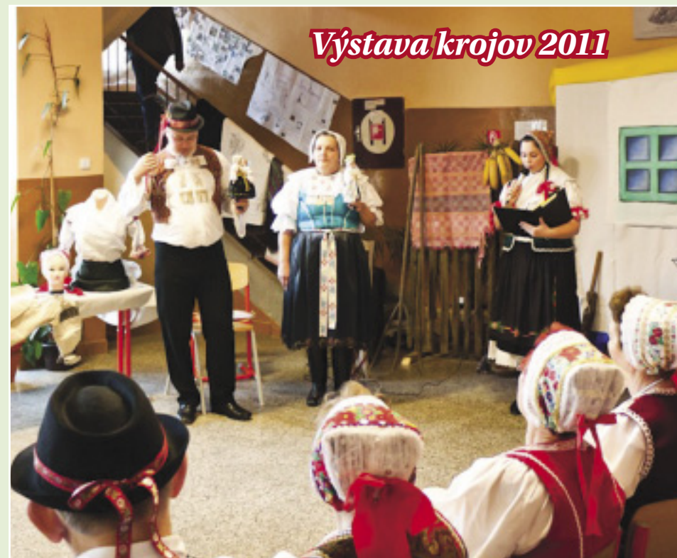
Výstava krojov 2011