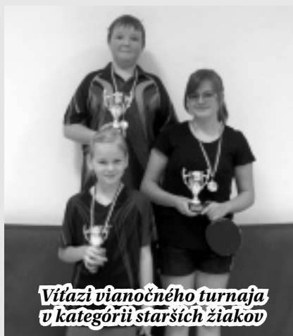
Vítazi vianočného turnaja v kategórii starších žiakov