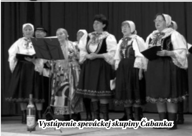
Vystúpenie speváckej skupiny Čabanka