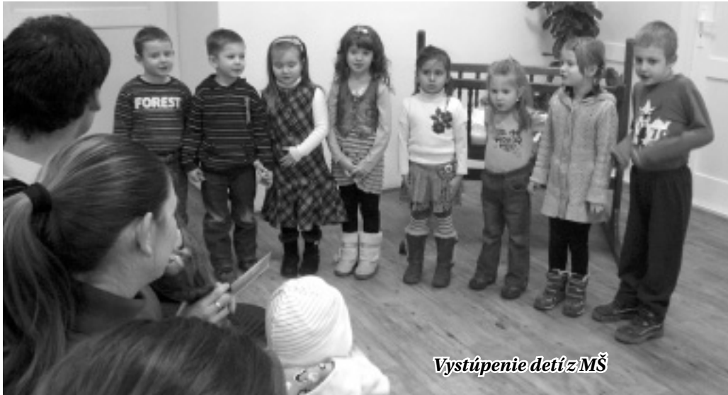
Vystúpenie detí z MŠ