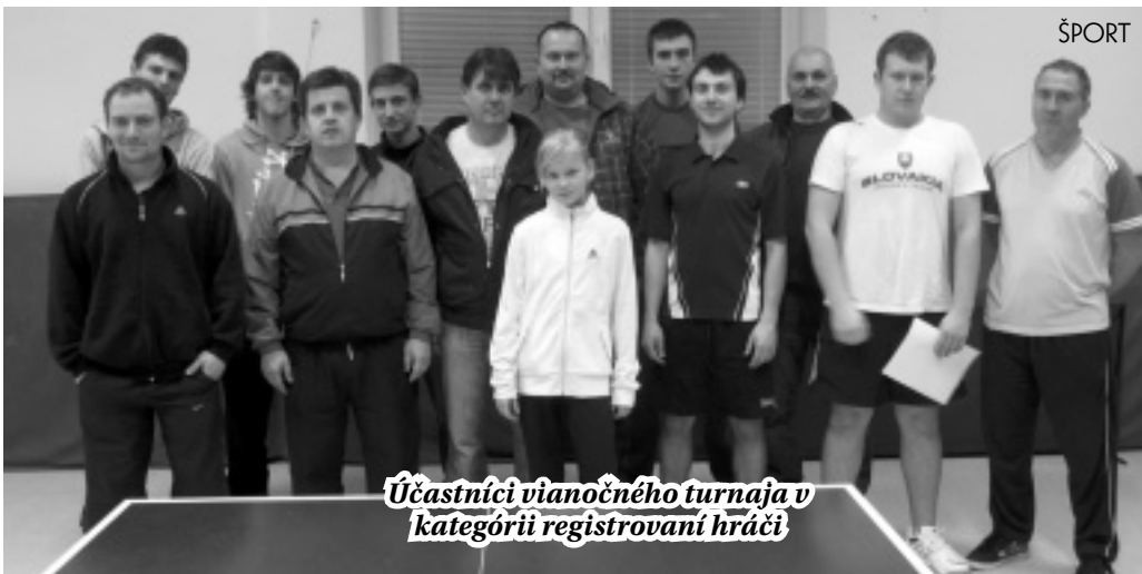
Účastníci vianočného turnaja v kategórii registrovaní hráči