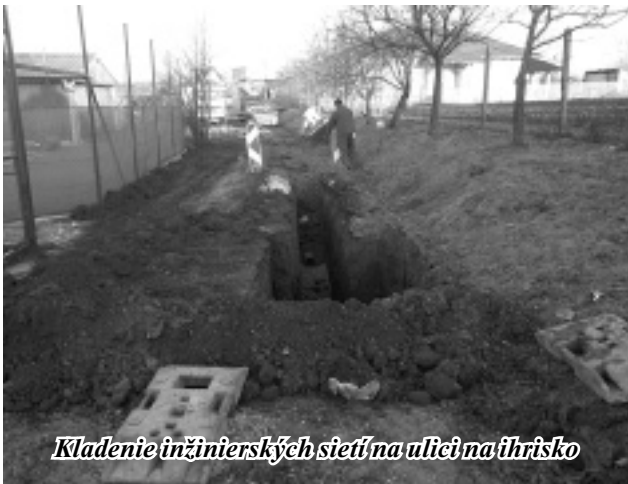
Kladenie inžinierských sietí na ulici na ihrisko

nančne veľmi náročné a z toho dôvodu sme odkázali na žiadanie financií z enviroföndu alebo euroföndov. Sú to projekty na kanalizáciu a čistiareň odpadových vôd, obecné chodníky a rekonštrukcia obecných ciest. Predpokladáme, že v budúcom programovacom období bude možné znova požiadať o financie z uvedených fondov. Projekt odpadového hospodárstva pokračuje. Dúfajme, že konečne sa v tomto roku rozbehne aspoň jeho prvá časť, t.j. kompostáreň vo Výčapoch – Opatovciach. Po veľkej námaha vlastníkov priemyselnej zóny sa naskytuje možnosť výstavby dvoch firiem, avšak vzhľadom na doterajší vývoj prílevu investícií budeme radšej zdržanliví.