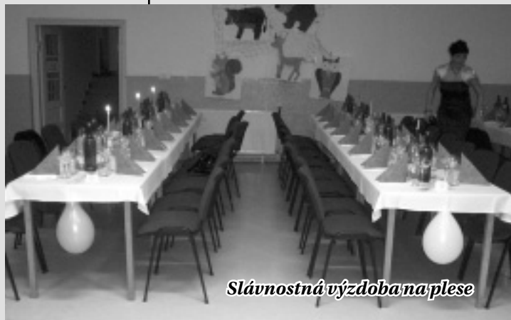
Slávnostná výzdoba na plese