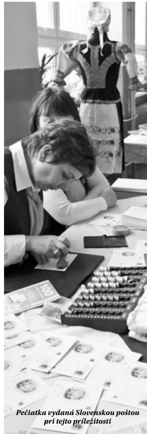
Pečiatka vydaná Slovenskou poštou pri tejto príležitosti

rukávce sa obliekal lajblík-vesta, ktorá bola príbuznej farby ako sukňa. Po celej šírke bola zdobená výšivkami alebo mašľami. Na dolnej časti bola našitá sesla-voľník, ktorý nemal byť rovný. Vo sviatočné dni ženy nosili do kostola polovičky, ktoré boli biele šlingované a vyšívane na dierky. Avšak polovičky poznáme aj farebné-gonfláše. Obuté nosili čizmy a poltopánky.