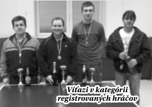
Vítazi v kategórii registrovaných hráčov