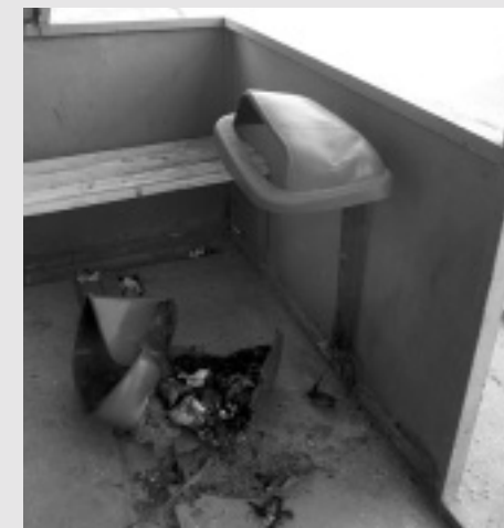
Vyčítanie vandalov - Podpálený kôš na autobusovej zastávke

bytoviek, ktoré kosením upravujú zamestnanci obce.