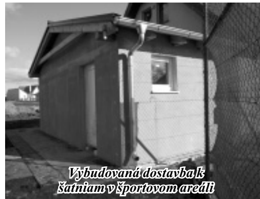
Vybudovaná dostavba k šatňiam v športovom areáli

mom porušujete zásady ich výstavby. Všetky doteraz postavené nevyhovujú stavebným predpisom, sú teda zlé, vhodné na zbúranie a rekonštrukciu. Ďalším vrcholom arogancie je to, že bez stavebného povolenia budujete ohrady svojich pozemkov hraničiacich s obecným priestranstvom, ktoré častokrát zaberáte. Sú to nepovolené stavby, na ktoré musí podľa stavebného zákona byť vydané rozhodnutie o zbúraní. Prosíme Vás preto, aby ste aj v týchto prípadoch prišli na obecný úrad a poradili sa o možnostiach zlegalizovania týchto stavieb.