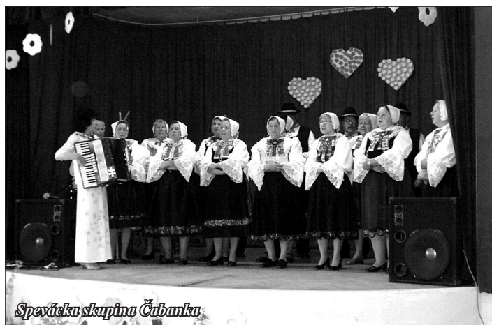
Spevácka skupina Čabanka