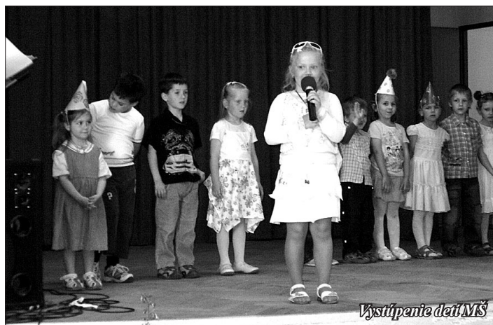
Vystúpenie detí MŠ