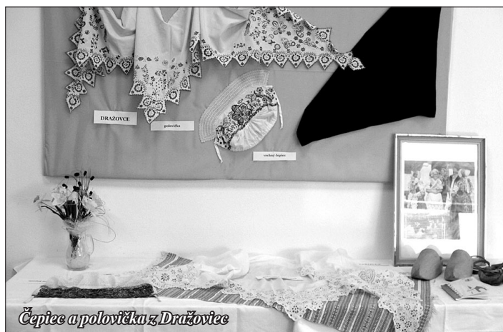
Čepce a polovička z Dražoviec

né príležitosti. Kroje predstavujú odev obyvateľov dediny - žien, mužov a detí. Na výstave si návštevníci mohli z blízka prezrieť jednotlivé časti krojov ako tačle, krézel, čepce, prucle, košele, rukávce. Zaujímavosťou výstavy bol ženský a mužský svadobný kroj z Lukáčoviec, detská krstná košielka z Čabu, či obuv ako čižmy, krpce a dreváky z Dražoviec a mnoho iného. Ako každý kroj, aj vystavované kroje majú svoje lokálne špecifiká viditeľné najmä vo výzdobe, v jej farebnosti, technike zdobenia a ornamentoch. Úspechom boli aj staré fotografie našich prastarých rodičov v krojoch hlavne u strednej generácie, na ktorých spoznávali svojich príbuzných predkov. Za zapožičanie týchto vzácných kusov, či už krojov alebo starozitností patrí veľká vďaka všetkým tým, ktorí doma „opatrujú“ tieto skvosty našej kultúry a dedičstva a zachovávajú ho pre budúce generácie. M. Báležová