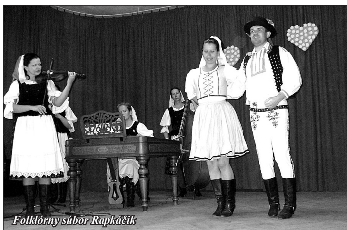
Folklórny súbor Rapkáčik

né príležitosti. Kroje predstavujú odev obyvateľov dediny - žien, mužov a detí. Na výstave si návštevníci mohli z blízka prezrieť jednotlivé časti krojov ako tačle, krézel, čepce, prucle, košele, rukávce. Zaujímavosťou výstavy bol ženský a mužský svadobný kroj z Lukáčoviec, detská krstná košielka z Čabu, či obuv ako čižmy, krpce a dreváky z Dražoviec a mnoho iného. Ako každý kroj, aj vystavované kroje majú svoje lokálne špecifiká viditeľné najmä vo výzdobe, v jej farebnosti, technike zdobenia a ornamentoch. Úspechom boli aj staré fotografie našich prastarých rodičov v krojoch hlavne u strednej generácie, na ktorých spoznávali svojich príbuzných predkov. Za zapožičanie týchto vzácných kusov, či už krojov alebo starozitností patrí veľká vďaka všetkým tým, ktorí doma „opatrujú“ tieto skvosty našej kultúry a dedičstva a zachovávajú ho pre budúce generácie. M. Báležová