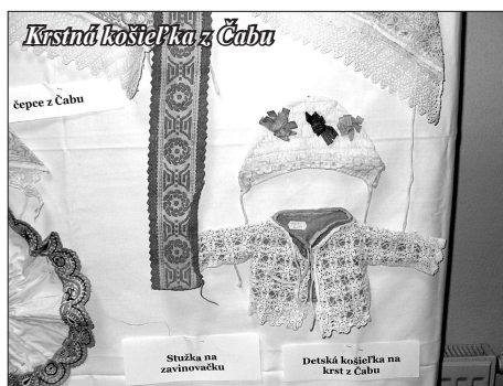
Krstná košielka z Čabu