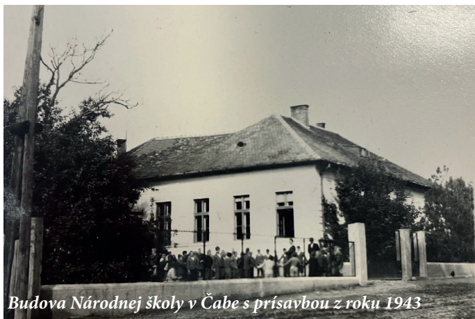
Budova Národnej školy v Čabe s prísavbou z roku 1943

V tomto čísle pokračujeme v prepisoch školskej kroniky a to zo školských rokov 1951/52