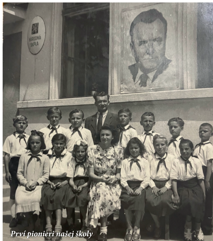
Prví pionieri našej školy

Nová socialistická škola má vychovávať človeka uvedomelého budovateľa lepšieho zajtrajška ľudstva. Prostriedkom k dosiahnutiu tohto cieľa je i dobrovoľná uvedomelá kázeň a preto nemá v nej miesta zastrašovanie tobôž nie telesné tresty. Od začiatku školského roku je v platnosti nový „školský poriadok“. Jeden zo spôsobov zlepšenia školskej práce vo vyučovaní a vo výchove je dávanie si záväzkov. Žiaci i učelia dávali si záväzky k 34. výročiu októbrovej revolúcie, k 50. narodeninám s. Širokého a k iným príležitostiam. Nová socialistická škola vypovedala neúprosný boj i proti prepádaniu žiactva. Na škole boli žiaci omeškaní v učive vyučovaní v