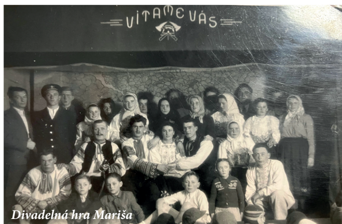
Divadelná hra Mariša

Článok v okresných roľníckych novinách Slobodný roľník