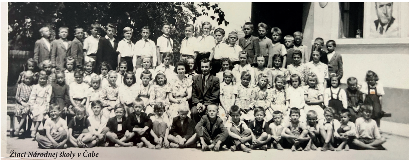
Žiaci Národnej školy v Čabe

V školskom roku odpracoval riaditeľ školy 1 298 mimoškolských pracovných hodín (osveta, funkcie)