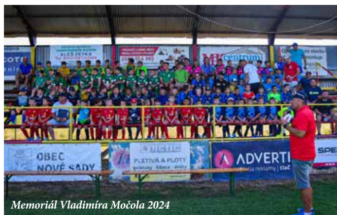
Memoriál Vladimíra Močola 2024