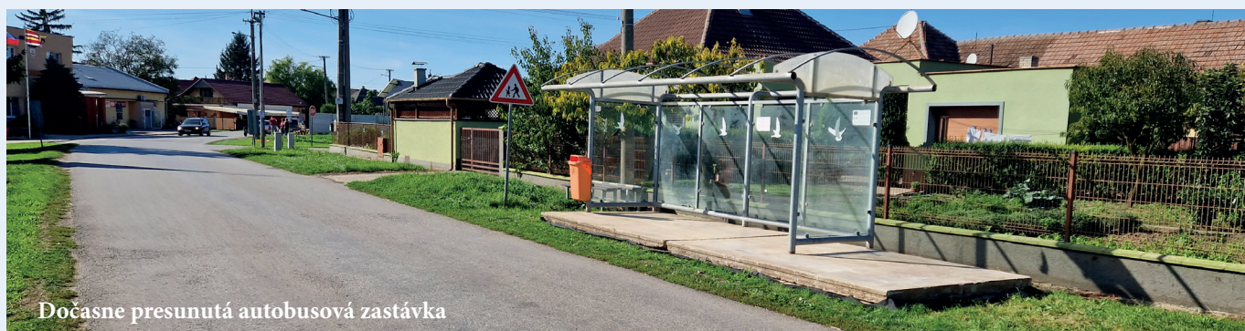
Dočasne presunutá autobusová zastávka