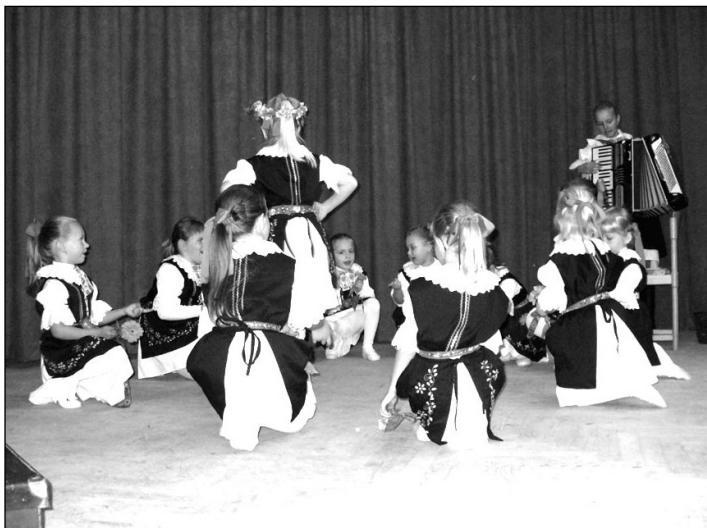
Detský folklórny súbor Pelikánik.