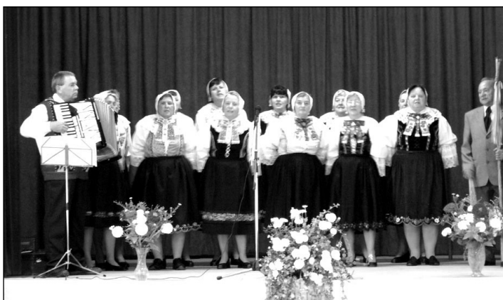
Spevácka skupina Čabanka.