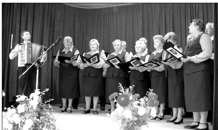
Spevácka skupina Lužiančanka..