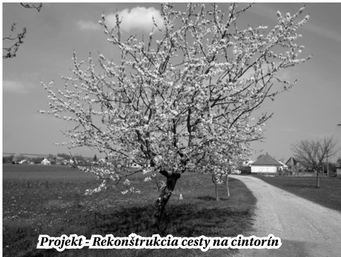
Projekt - Rekonštrukcia cesty na cintorín

prvkov, čím sa zmenila na viacúčelovú miestnosť. Projekt rieši aj opravu komínov, strechy, chodby do kultúrneho domu a tiež výmenu dverí.