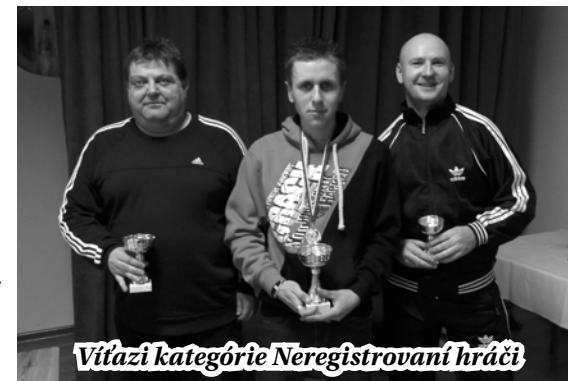
Vítazi kategórie Neregistrovaní hráči