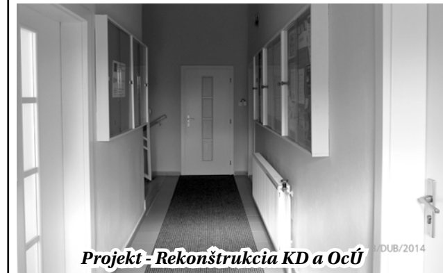
Projekt - Rekonštrukcia KD a OcÚ