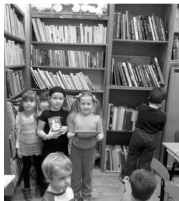
Škôlkari v knižnici