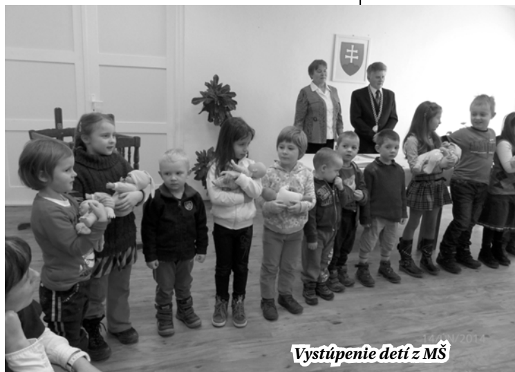
Vystúpenie detí z MŠ