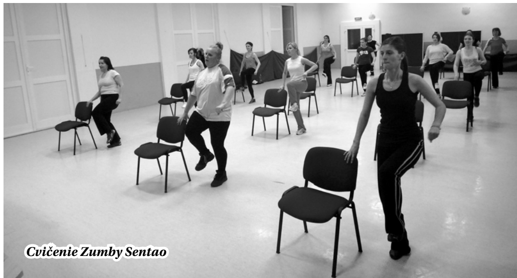
Cvičenie Zumbly Sentao