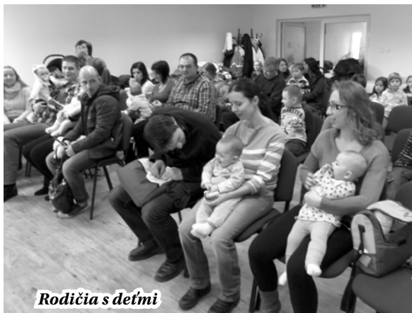
Rodičia s deťmi