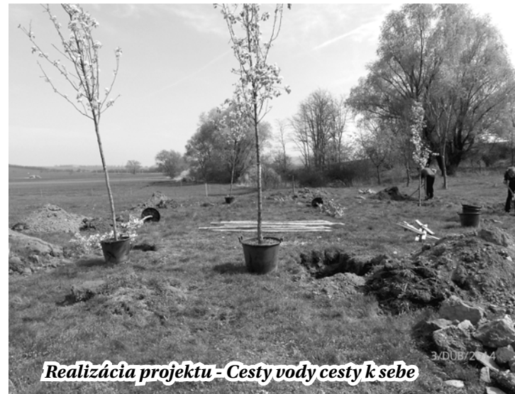
Realizácia projektu - Cesty vody cesty k sebe

Projekt zatiaľ nebol hodnotený, avšak predpokladáme, že sa nám aj tento podarí do konca roku úspešne zrealizovať. Všetky doteraz uvádzané projekty sú získané prostredníctvom Občianskeho združenia Mikroregión Radošinka z Ministerstva pôdohospodárstva SR v rámci Programu rozvoja vidieka.