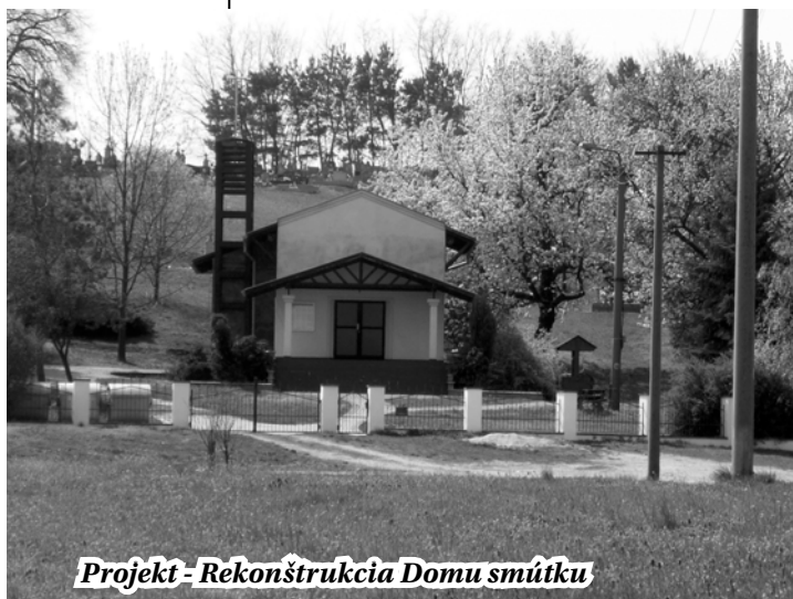
Projekt - Rekonštrukcia Domu smútku

Projekt „Rekonštrukcia verejných priestrastiav pri dome smútku a kultúrnom dome“ je posledným projektom, ktorým by sme chceli ukončiť rekonštrukcie a investičnú činnosť v obci v tomto roku.