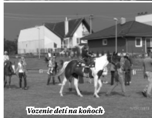
Vozenie detí na koňoch