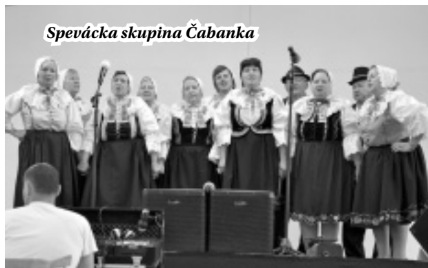
Spevácka skupina Čabanka