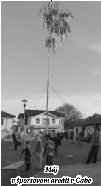
Máj v športovom areáli v Čabe

Samotný máj bol pôvodne mladý stromček, najčastejšie smrekový, jedľový alebo brezový, ktorý mal symbolický význam a bol výrazom prírodného mýtu v boji jari so zimou, života so smrťou. Mladí muži, sa v krojoch a s muzikou vydávali po obci za mladými dievčatami - najmä za svojimi milými, ktoré boli