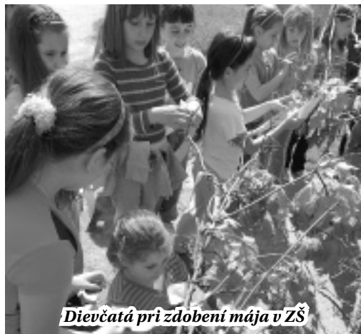
Dievčatá pri zdobení mája v ZŠ

súce na vydaj. Svojmu dievčaťu, svojej vyvolenej, srdcu milej dievčine postavili pekný, stužkami ozdobený máj, ako symbol ich náklonnosti, sympatií a lásky.