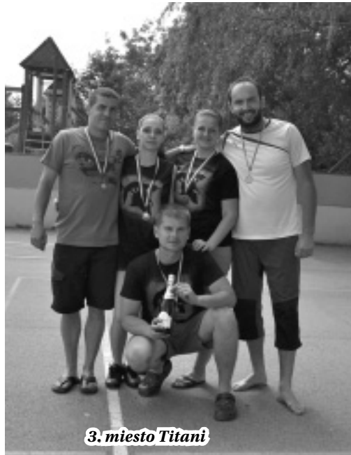
3. miesto Titani

Chcem poďakovať všetkým organizátorom za ich nadšenie a ochotu (a aj kuchárske umenie). Ich úsilie sa pretavilo do mimoriadne príjemného športovo-priateľského stretnutia. Rovnako chcem poďakovať aj účastníkom turnaja za ich vytrvalosť a prítomnosť, bez nich by sa turnaj konať nemohol. V neposled-