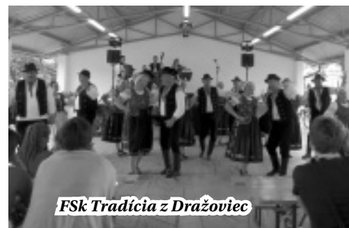
FSK Tradícia z Dražoviec