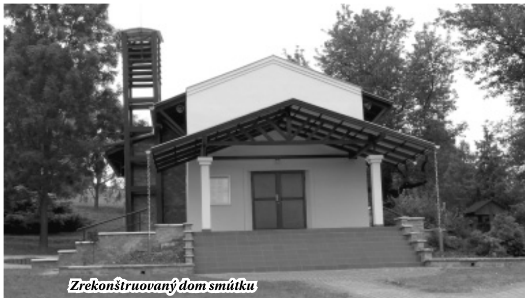
Zrekonštruovaný dom smútku

komunikácie na cintorín“ bude možné konečne zrealizovať, pretože Slovenský pozemkový fond súhlasil s bezodplatným prevodom pozemku, na ktorom je cesta vybudovaná, pre obec. Predpokladáme, že v mesiacoch júl až august by cesta mohla byť upravená a vyasfaltovaná. V tomto roku nám zostáva zrealizovať ešte jeden projekt, t.j. „Rekonštrukcia verejných priestranstiev pri kultúrnom dome a dome smútku“. Jeho realizácia bude uskutočnená v priebehu septembra, vzhľadom na to že ide o rôzne sadbové úpravy. Dúfame, že bude počasie pre tento projekt priaznivé. Na prázdniny máme naplánovaný ešte jeden projekt pre našu materskú školu. Bude sa v nej rekonštruovať sociálne zariadenie pre deti a personál. Práce by mali začať už v druhom, príp. treťom júlovom týždni. Práce budú ukončené do konca augusta tak, aby nebol narušený nástup detí do nového školského roku.