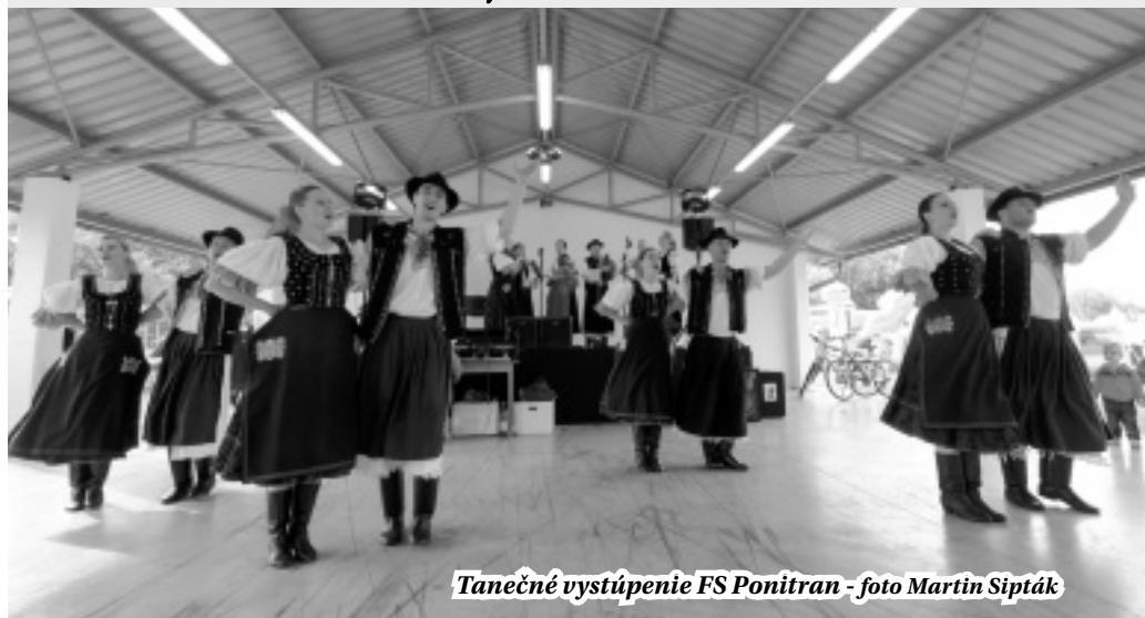
Tanečné vystúpenie FS Ponitran

5. júl 2014 bol pre našu obec veľmi významným dňom. V športovom areáli sa konal 9. ročník Obecných osláv. Tieto oslavy sa v obci stali tradíciou a medzi občanmi sa tešia veľkej obľube. Príprava týchto osláv začína už niekoľko mesiacov dopredu, zabezpečenie pódia, ozvučenia, súborov... Ale to najdôležitejšie sa koná v sobotu od skorého rána a to je varenie štyroch kotlov gulášu. Na jeho prípravu je potrebný celý tím ochotných a spoľahlivých ľudí, či už pri čistení zemiakov a cibule alebo pri samotnej príprave. Zo srdca ďakujem všetkým, ktorí mi pomáhali pri príprave a zabezpečení všetkého potrebného.