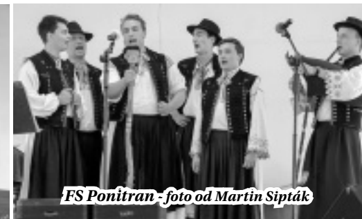
FS Ponitran