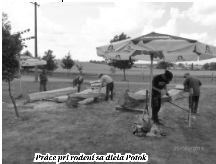
Práce pri rodení sa diela Potok