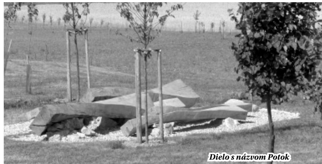
Dielo s názvom Potok

s našimi umelcami – rezbármi a keramikármi z územia našej miestnej akčnej skupiny. Bolo by vhodné, keby takáto spolupráca v rámci mikroregiónov pokračovala aj v budúcnosti a obohacovala nás vzájomne aj v iných oblastiach kultúrneho a spoločenského života.