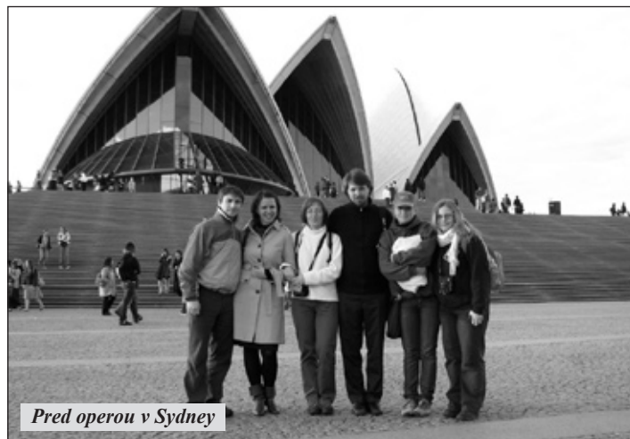
Pred operou v Sydney