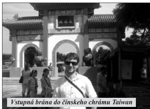
Vstupná brána do čínskeho chrámu Taiwan

Aj tu na tomto veľkom zhromaždení mladých kresťanov sme zakúsili prítomnosť a moc Ducha v živote Cirkvi. Videli sme Cirkev takú, aká je v skutočnosti: Kristovo telo, živé spoločenstvo lásky, ktoré objíma