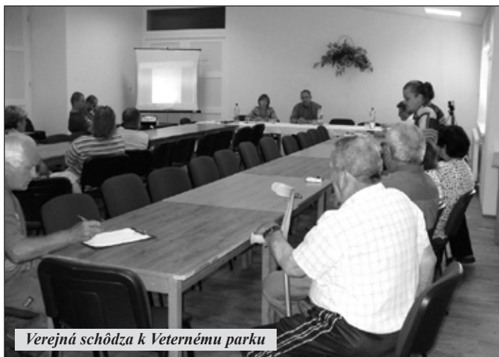
Verejná schôdza k Veternému parku