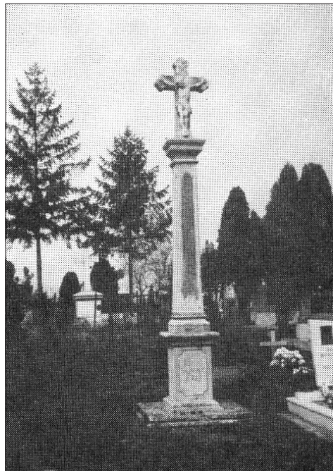
Cintorín - hlavný kríž z roku 1773.